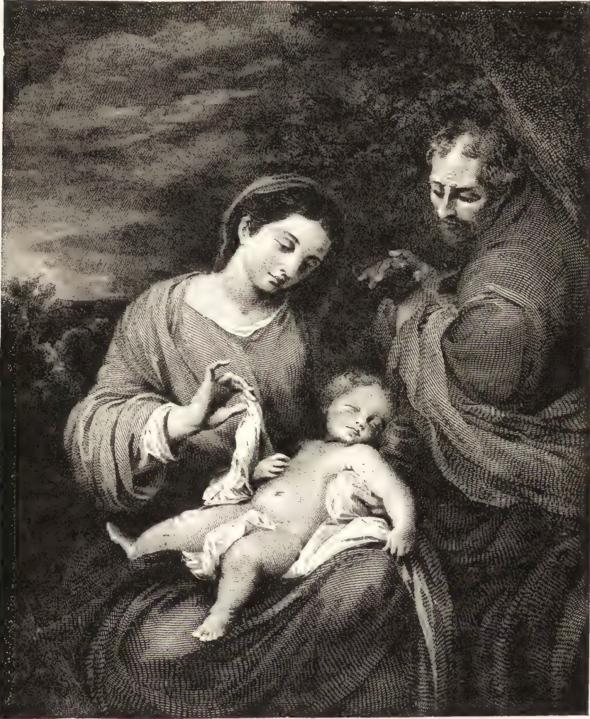
LA SAINTE FAMILLE.

huit grandes compositions et deux moindres. Le maréchal Soult en enleva cinq. Une, seulement, la Sainte Élisabeth de